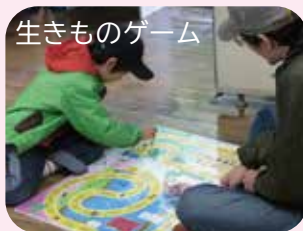
生きもののゲーム