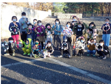
笛吹市との協働事業

また、本レポートで紹介している事業・取り組みは積極的に外部へ情報発信を行っており業界関係者が集まる機会にはポスター出展・発表等を行っている。