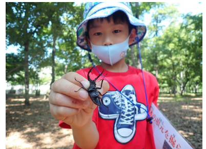
生きもの博士養成講座（むし編）