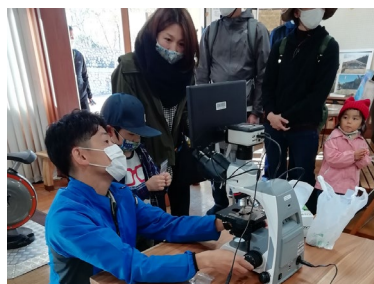
顕微鏡を使用した協働事業