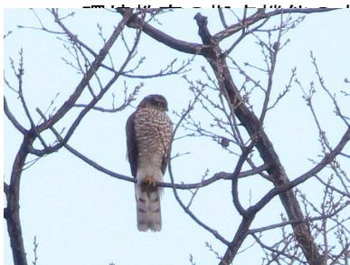
ハイタカ[絶滅危惧Ⅱ類(山梨県)]

○令和 2 年度は、新型コロナウイルスの感染拡大の影響により臨時休園・イベント中止の期間があり、且つ、プログラムの参加定員を半数に制限する等の対応を講じたことから参加者数は減少に転じているものの「森の中で楽しみたい」という参加者のニーズを満たす多様なテーマのプログラムを企画し、