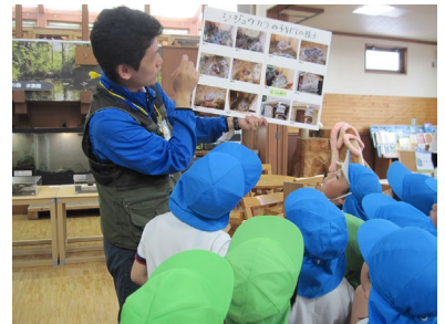
幼稚園向けプログラム