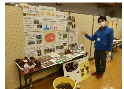
やまなし環境教育ミーティング出展