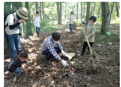
市民参加型の森づくり活動

貴重な河畔林の動植物を守るため「金川の森 生物多様性保全計画」を策定し、調査および保全活動を行っている。保全の取り組みでは、市民参加型のイベントを企画し、来園される親子等とともに森づくりの活動を進めている。