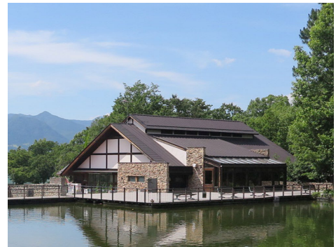
サービスセンター

園内の主要構成樹種はクヌギ、コナラ、エノキ、ケヤキ等の落葉広葉樹で、これらの多くは開園以前に水害防備林として明治時代に造林されたものである。公園に飛来する野鳥はシジュウカラ、エナガ等のカラ類、キツツキ類、カモ類のほか、ハイタカ、ハヤブサ等の猛禽類など年間で 60 種以上が観察できる。林内には、カブトムシ、ノコギリクワガタ、ヤマトタマムシ、オオムラサキ等の雑木林を代表する昆虫類が生息しており、ヒラタクワガタ、ウマノオバチ等の希少種も確認されている。